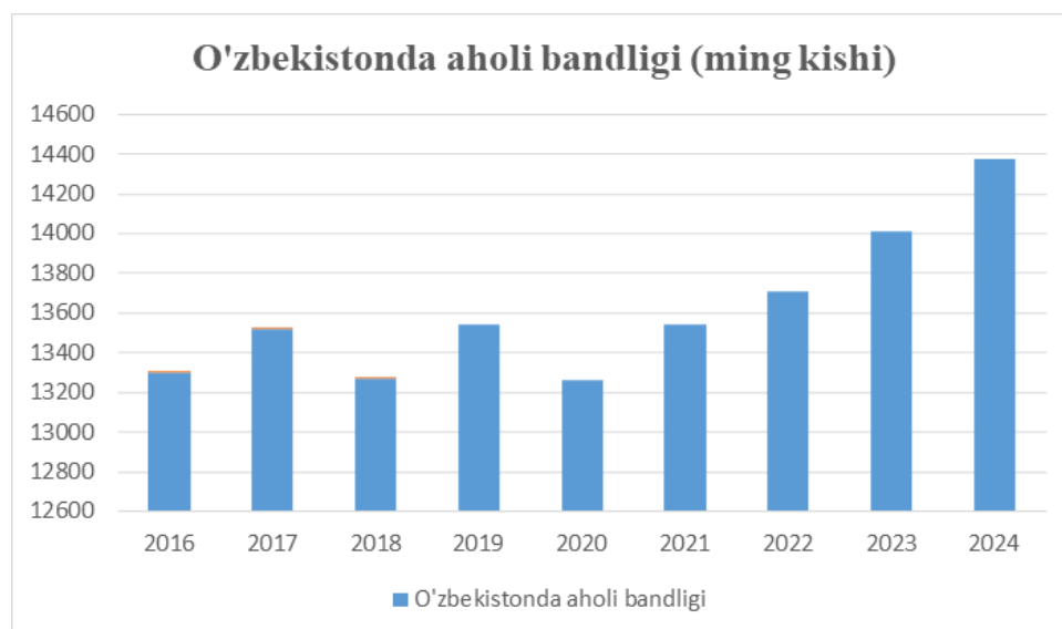
1-rasm. 2016- 2024 yillarda O'zbekistonda aholi bandligi ko'rsatkichlar holati[8]

Bizningcha, O'zbekistonda turizm xizmatlari sohasini rivojlantirish, turizm xizmatlarining sifati va samaradorligini jahon talabi darajasiga yetkazish hamda mamlakat turizm jozibadorligini oshirish uchun turoperatorlarning turizm bozoridagi mavqeini mustahkamlash zarur (1-rasm).