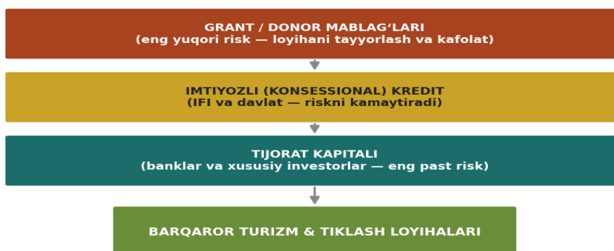
3-rasm. Orolbo'yi mintaqasida aralash moliyalashtirish (blended finance) mexanizmi 5