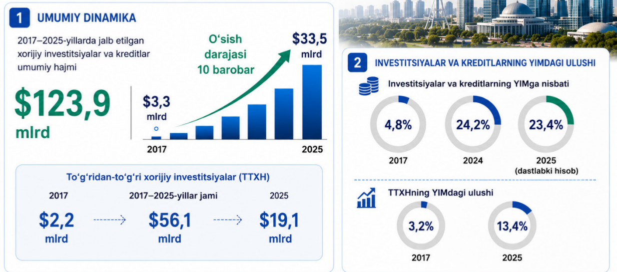
1-rasm. Xorijiy investitsiyalar

O‘zbekiston sharoitida kapital bozorini chuqurlashtirish uchun IPO va SPO bozorini kengaytirish, davlat ishtirokidagi yirik korxonalar aksiyalarini ommaviy joylashtirish hamda xorijiy institutsional investorlar uchun qulay huquqiy muhitni yanada takomillashtirish muhim ahamiyat kasb etadi.