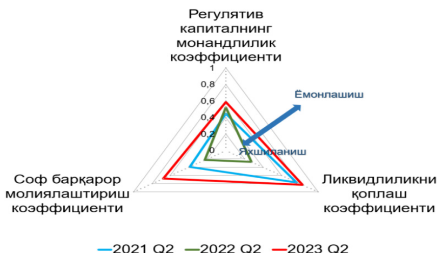
3-rasm. Mamlakat bank tizimi bardoshlilik holati 3

Milliy tijorat banklari faoliyatida aktivlar, ularning tarkibi, sifati, daromadliligi, likvidligi va ularning dinamikasini o'rganib borish katta ahamiyatga ega. Bank aktivlari tarkibi deyilganda balans yakuniga ko'ra har xil sifatdagi aktivlar salmog'i tushunilib, bankning aktiv va majburiyatlarini risk, daromadlilik va likvidlikka ta'siri nuqtai nazaridan taqqoslama tahlil qilish maqsadga muvofiq bo'ladi (3-rasm).