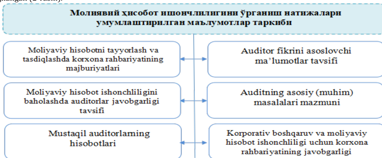
2-rasm. Moliyaviy hisobot ishonchligini o'rganish natijalari umumlashtirilgan ma'lumotlar tarkibi 11

malaka va ko'nikmaga ega bo'lmasa, auditorlik tashkiloti tekshiruvni o'tkazishdan bosh tortishi maqsadga muvofiq. Ta'kidlash joizki, amaldagi Auditning xalqaro standartlariga muvofiq tekshiruv yakunida auditor fikrlari faqatgina auditorlik xulosasida aks ettirilishi belgilangan. Biroq xalqaro standartlarda auditorlik xulosasida tekshiruv natijalari to'g'risida batafsil ma'lumot aks ettirilishi bo'yicha aniq talablar belgilanmagan. Bu esa, fikrimizcha, tekshiruv buyurtmachilari tomonidan auditorlik tekshiruvi natijalari to'g'risida batafsil ma'lumot olish imkonini bermaydi. Biroq amaldagi 200-son "Moliyaviy hisobot auditini tartibga solishning maqsadi va umumiy tamoyillari" nomli Auditning xalqaro standarti va 700-son "Moliyaviy hisobot bo'yicha auditorlik hisoboti (xulosasi)" nomli xalqaro standartlarda tekshiruv natijalari quyidagi turkumdagi ma'lumotlarni o'z ichiga olishi belgilangan (2-rasm).