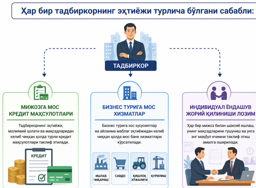
2-rasm. Tijorat banki tomonidan tadbirkorlarning ehtiyoji turlicha bo'lgan xizmatlari sifatini oshirish.

Tadbirkorlar uchun bank xizmatlari sifati moliyaviy xizmatlarning tezkorligi, ishonchliligi, qulayligi, xavfsizligi hamda mijoz ehtiyojlariga mosligi bilan belgilanadi. Ayniqsa, tadbirkorlik subyektlari uchun kredit olish jarayonini soddalashtirish muhim ahamiyatga ega. Bunda hujjatlar sonini kamaytirish, onlayn ariza topshirish tizimini joriy etish hamda kredit bo'yicha qaror qabul qilish muddatini qisqartirish bank xizmatlari samaradorligini oshirishga xizmat qiladi. Tijorat banklari yuqoridagi yo'nalishlarda faoliyatini izchil tashkil etsa, tadbirkorlar moliyaviy resurslarga qisqa muddatda ega bo'lish imkoniyatiga ega bo'ladi. Bu esa ularning investitsion faolligini oshirish, ishlab chiqarish jarayonlarini kengaytirish va iqtisodiy barqarorligini mustahkamlashga ijobiy ta'sir ko'rsatadi (2-rasm).