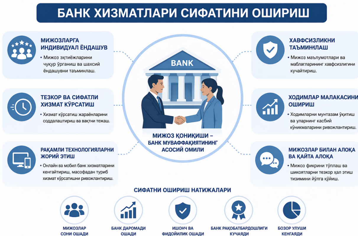
1-rasm. Tijorat banki tomonidan xizmatlar sifati oshirish.

Tadbirkorlik faoliyatini rivojlantirishda tijorat banklari xizmatlarining sifati hal qiluvchi ahamiyatga ega. Bank xizmatlarining yuqori darajada tashkil etilishi tadbirkorlik subyektlarini moliyaviy resurslar bilan o'z vaqtida, qulav va samarali ta'minlash imkonini yaratadi (1-rasm).