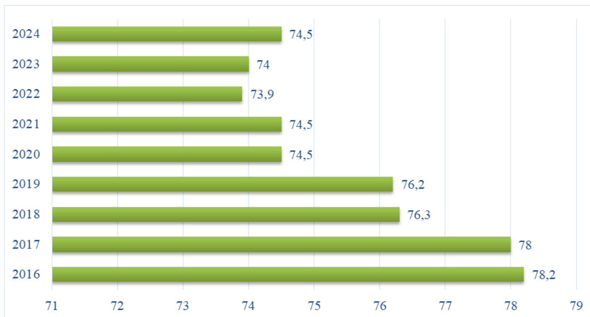
1-rasm. 2016-2024-yillarda Respublika bo'yicha kichik tadbirkorlik subyektlarining jami bandlikdagi ulushi (foizda) 1

Bandlikni ta'minlash makroiqtisodiy barqarorlik, ijtimoiy muvozanat va inklyuziv rivojlanishning fundamental indikatorini hisoblanadi va aynan kichik tadbirkorlik subyektlari ushbu jarayonning tizim hosil qiluvchi tayanchi sifatida namoyon bo'ladi. Mazkur sektor mehnat bozorida strukturaviy elastiklik, yuqori moslashuvchanlik va kapital aylanish tezligi bilan ajralib turib, qisqa muddatda yangi ish o'rinlarini yaratish hamda iqtisodiy konyunktura o'zgarishlariga tezkor javob qaytarish imkoniyatiga ega (1-rasm).