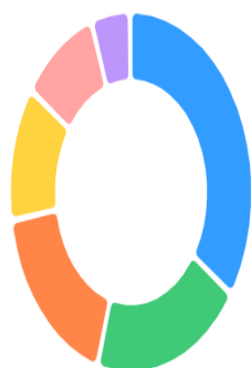
● Boshqa yo'nalishlar ● Ekologik transport ● Energiya tejamlor texnologiyalar ● Qayta ishlash sanoati ● Quyosh energetikasi ● Shamol energetikasi