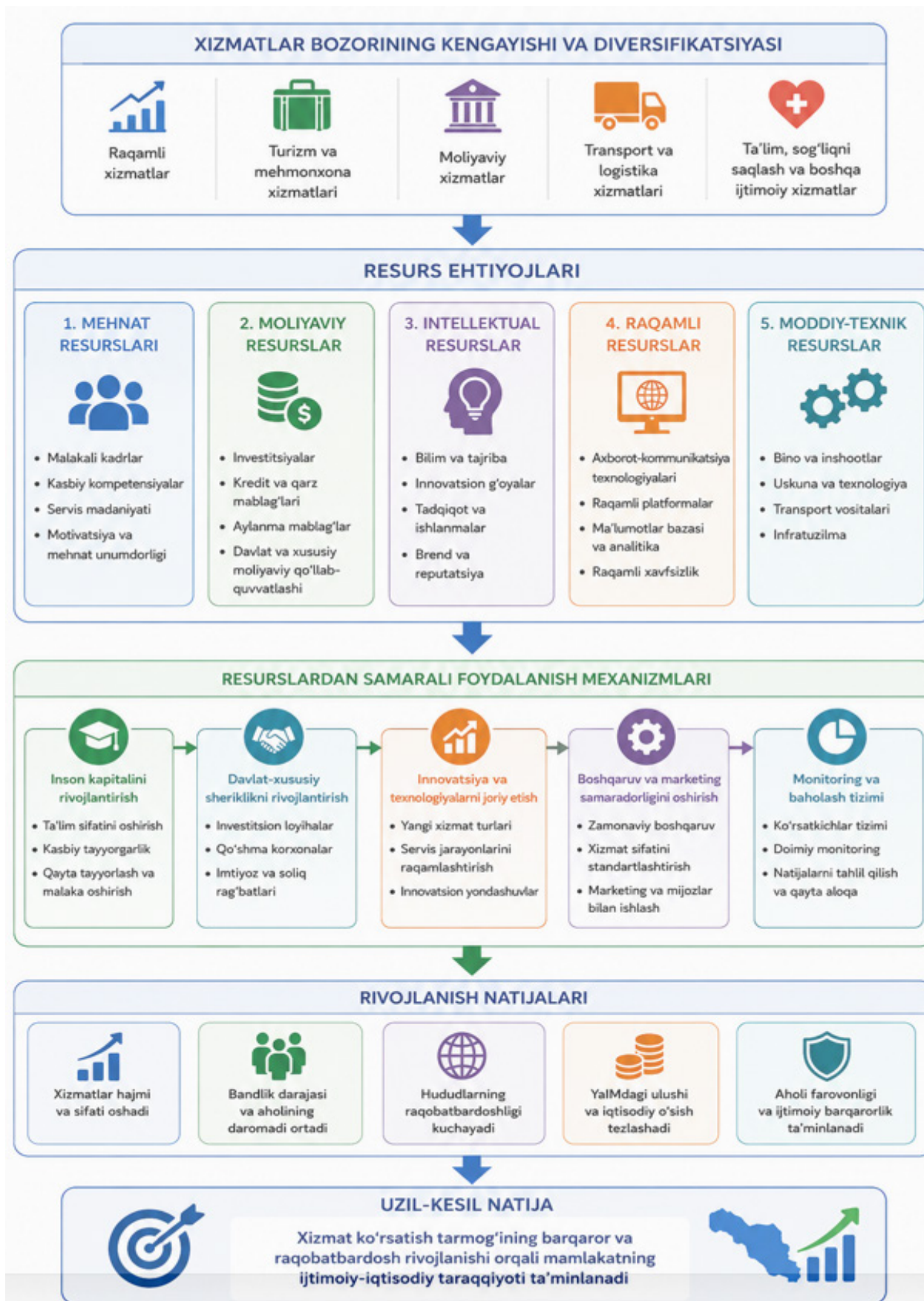
1-rasm. Xizmat ko'rsatish tarmog'ining resurs ehtiyojlari va rivojlanish mexanizmi.