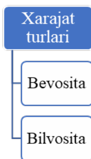
2-rasm. Savdo korxonalarida xarajat turlari

Zamonaviy iqtisodiy adabiyotlarda ham xarajatlarni doimiy va o'zgaruvchan turlarga ajratish boshqaruv qarorlarini asoslashda muhim ilmiy-uslubiy yondashuv sifatida qaraladi. Bu tasnif korxonada faoliyatining rentabelligini baholash, narx siyosatini shakllantirish hamda strategik rejalashtirish jarayonlarida keng qo'llaniladi.