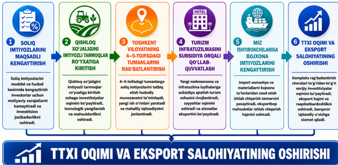
1–rasm. TTXIni jalb etishning ustuvor yoʻnalishlari

Qishloq xo'jaligi O'zbekiston iqtisodiyotining strategik tarmoqlaridan biri hisoblanadi. 2024–yilda respublikada yalpi qishloq xo'jaligi mahsuloti hajmi 444,6 trln so'mga yetgan bo'lib, so'nggi besh yil davomida 18,5 foizga o'sgan [9]. Mazkur ko'rsatkich qishloq xo'jaligi mahsulotlarini yetishtirish yo'nalishi xorijiy investitsiyalarni jalb etish uchun yuqori salohiyatga ega ekanligini ko'rsatadi.