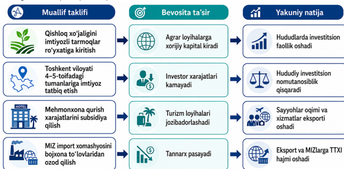
4-rasm. Muallif takliflarining TTXIni jalb etishga ta'siri

Mazkur takliflar iqtisodiyotning ustuvor tarmoqlariga xorijiy kapital oqimini kengaytirish, hududiy investitsion faollikni oshirish, eksport salohiyatini mustahkamlash va zamonaviy ishlab chiqarish infratuzilmasini rivojlantirishga xizmat qiladi (4-rasm).