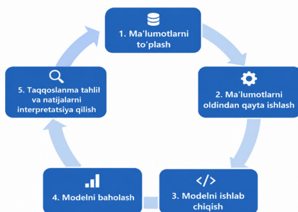
1-rasm. Tadqiqot metodologiyasi bosqichlari.

Shu sababli, yurak-qon tomir kasalliklarini tashxislash va bashorat qilish jarayonlarida Gradient Boosting modellarining imkoniyatlarini chuqurroq o‘rganish dolzarb ilmiy yo‘nalishlardan biri hisoblanadi. Ushbu kontekstda Gradient Boosting algoritmlarining samaradorligini oshirish, model parametrlarini optimallashtirish hamda diagnostik aniqlikni yanada takomillashtirishga qaratilgan qo‘shimcha ilmiy tadqiqotlar va amaliy tajribalarni amalga oshirish muhim ahamiyat kasb etadi (1-rasm).