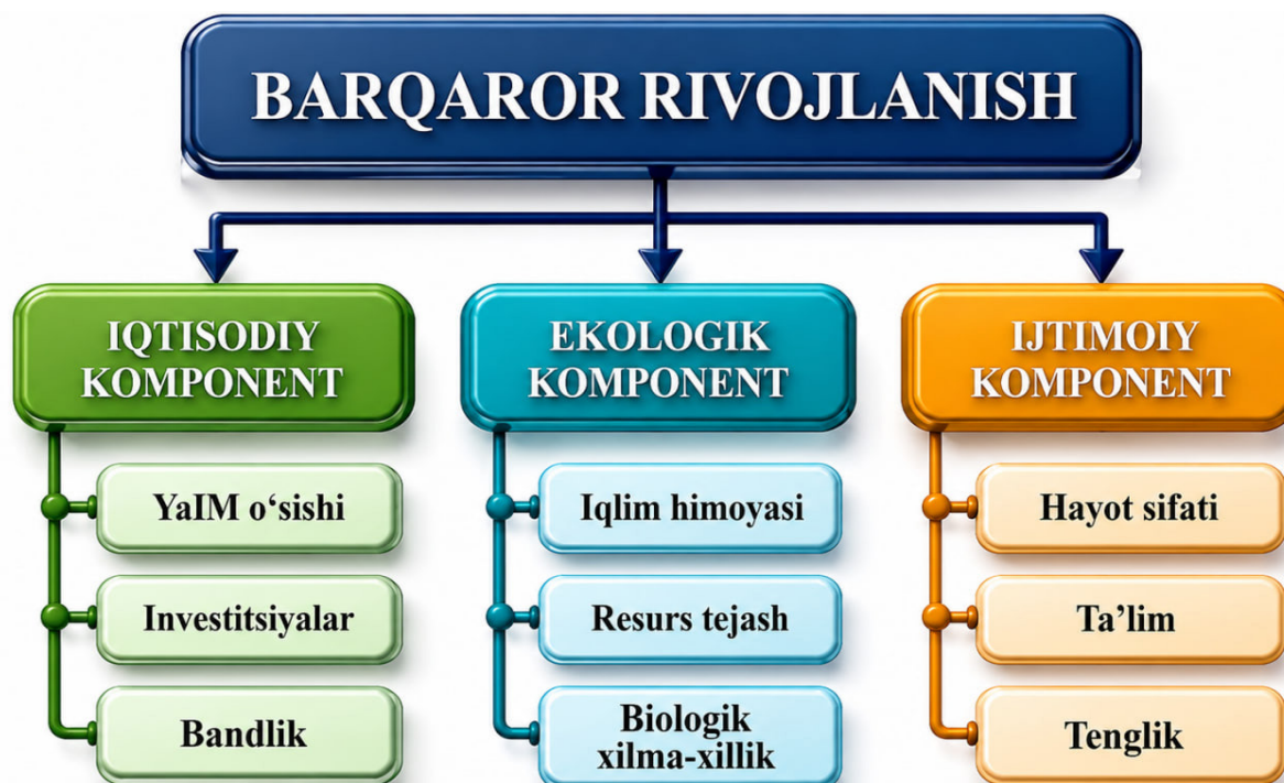
1-rasm. Barqaror rivojlanishning uch asosiy komponenti (ierarxik tuzilma)*