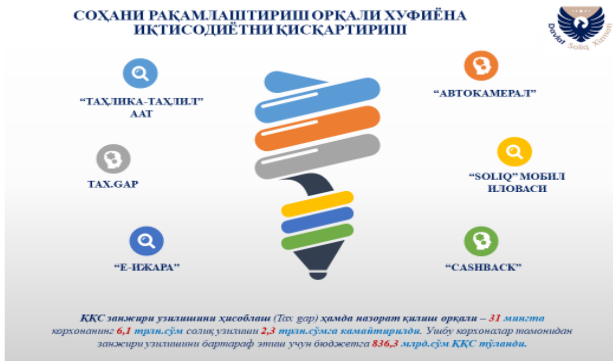
2-rasm. Soliq tizimini raqamlashtirish orqali xufyona iqtisodiyotni qisqartirish usullari 4

Ma'lumki, iqtisodiyotda norasmiy sektor ko'lamining kengayib borishi davlatning fiskal manfaatlariga salbiy ta'sir ko'rsatadi hamda uning ijtimoiy xizmatlarni samarali ko'rsatish imkoniyatlarini cheklaydi. Yashirin iqtisodiyot adolatli jamiyat va sog'lom raqobat muhitining shakllanishiga salbiy ta'sir ko'rsatishi mumkin. Norasmiy bandlik va ijtimoiy badallarning to'lanmasligi fuqarolarning kelgusidagi ijtimoiy ta'minot darajasiga ham ta'sir etadi. Shuningdek, norasmiy iqtisodiyotning keng tarqalishi iqtisodiy xavfsizlik va huquqiy tartibot tizimiga ham muayyan salbiy oqibatlarni yuzaga keltirishi mumkin. Shu sababli, O'zbekistonda xufyona iqtisodiyotga qarshi kurashishda barcha vositalardan, jumladan, fiskal instrumentlardan keng foydalanishga alohida e'tibor qaratilmoqda (2-rasm).