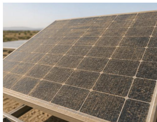
Changlangan fotoelektrik panel