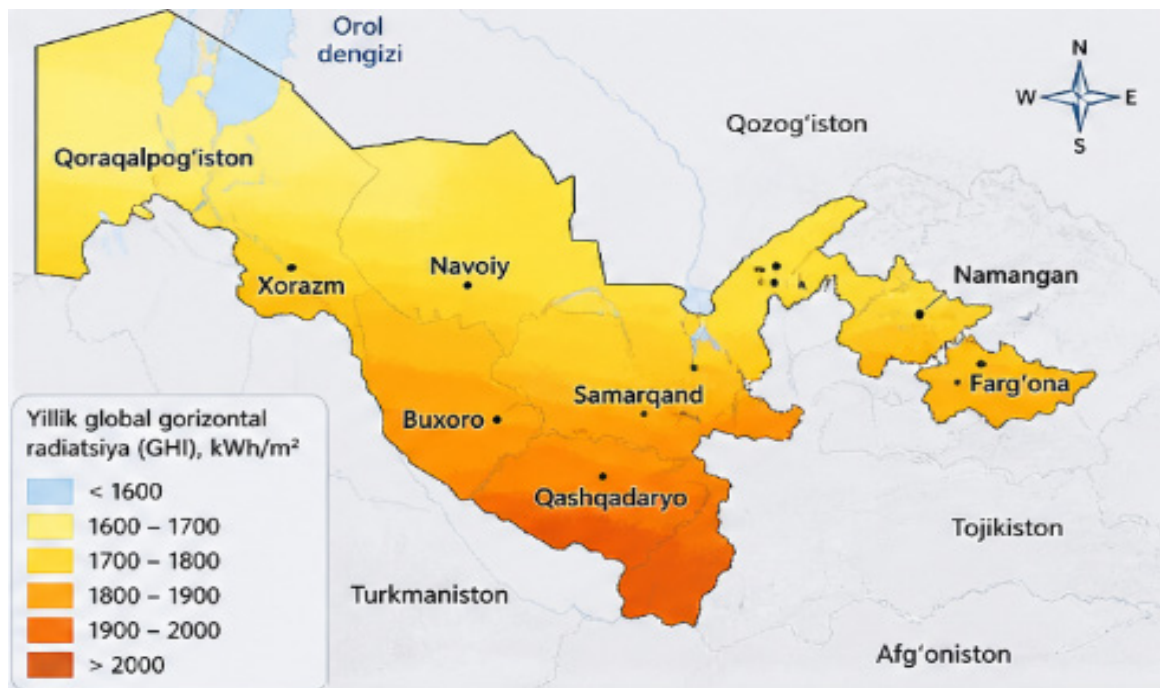
1-rasm. O'zbekiston iqlim sharoiti va chang tavsifi (hududlar kesimida) ®

Xorazm, Qashqadaryo hamda Surxondaryo viloyatlari ayniqsa yuqori quyosh energetikasi resurslari bilan ajralib turadi. Mazkur hududlarda GHI ko'rsatkichi 2000–2200 kWh/m 2 ga yetadi. Shu bilan birga, ushbu hududlarda qurg'oqchilik, shamol faolligi va atmosfera changlanishiga oid meteorologik ko'rsatkichlar ham yuqori darajada kuzatiladi [5] (1-rasm).