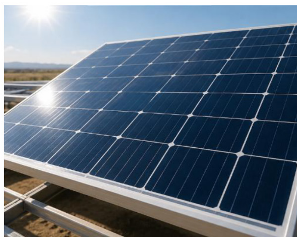
Toza fotoelektrik panel

Chang zarralari quyosh fotoelektrik panellari yuzasida to'planib, bir nechta asosiy fizik jarayonlar orqali ularning samaradorligiga ta'sir ko'rsatadi. Birinchidan, chang qatlami quyosh nurlarining ma'lum qismini yutadi va qaytaradi, natijada fotoelektrik panel yuzasiga yetib keladigan yorug'lik oqimi kamayadi. Ushbu hodisa optik yo'qotishlar deb ataladi (3-rasm).