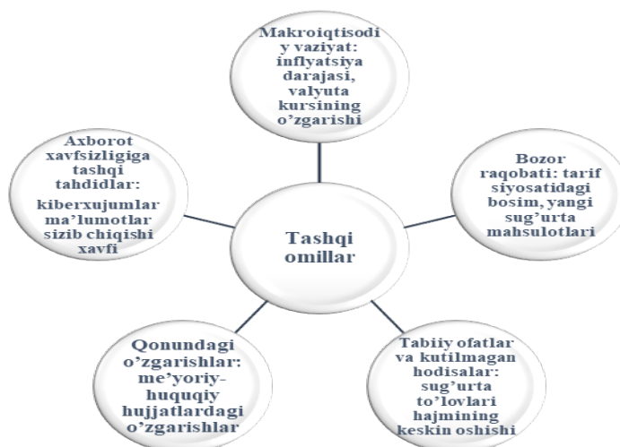
2-rasm. Ichki audit yillik rejasini tuzishda risklarni aniqlash va baholashga ta'sir qiluvchi tashqi omillar 4

Har bir aniqlangan riskning yuzaga kelish ehtimoli va uning kompaniya faoliyatiga ta'sir etish darajasi (yuqori, o'rta, past) maxsus risklar matritsasi yordamida baholanadi.