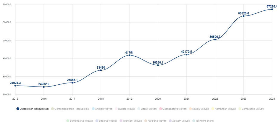
1-rasm. O'zbekiston tashqi savdo aylanmasining yillik dinamikasi (2015–2024-yillar) 2

Eksport tarkibidagi ijobiy o'zgarishlardan biri — to'qimachilik va oziq-ovqat mahsulotlari ulushining ortib borayotganidir. Xususan, 2017-yilda to'qimachilik eksporti 7–8 foiz atrofida bo'lgan bo'lsa, 2025-yilga kelib bu ko'rsatkich 12–14 foizgacha oshgan. Ushbu tendensiya davlatning “xom paxtadan — tayyor mahsulotga” yo'naltirilgan siyosati amaliy natijalar berayotganini ko'rsatadi. Shu bilan birga, oltin eksportiga bog'liqlik hali ham yuqori darajada saqlanib qolmoqda, bu esa global narxlar o'zgarishiga sezgirlikni oshiradi.