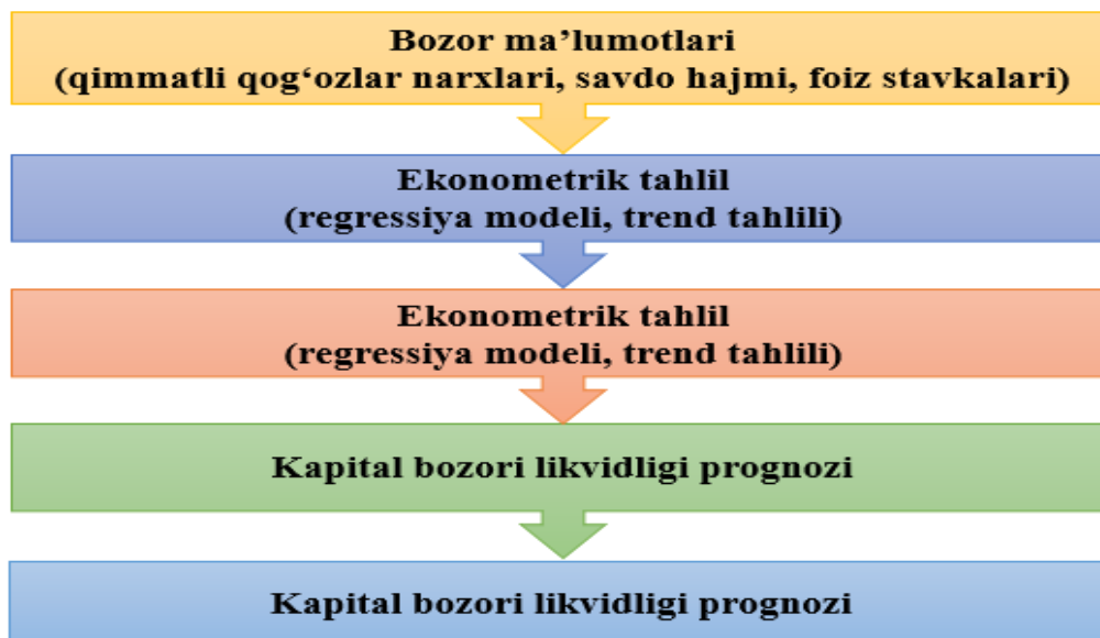
1-rasm. Bank investitsiya faoliyatini prognozlash mexanizmi 5

Shu sababli tadqiqotda ekonometrik modellar va neyro-tarmoqlar integratsiyasiga asoslangan prognozlash modeli taklif etildi. Ushbu model statistik bog'liqliklarni aniqlash bilan birga kapital bozoridagi murakkab nolinear o'zgarishlarni ham baholash imkonini beradi (1-rasm).