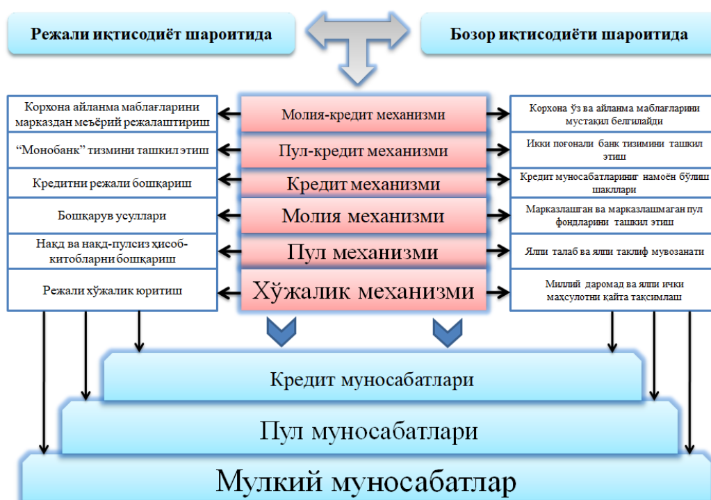
1-rasm. Turli iqtisodiy sharoitlarda iqtisodiy munosabatlarning bog'liqligi 4

Ushbu tahlil qilib o'tilgan iqtisodiy munosabatlar turli xil iqtisodiy mexanizmlar ta'siri doirasida rivojlangan va kengaygan. Quyidagi chizmada buni yaqqol ko'rish mumkin (1-rasm).