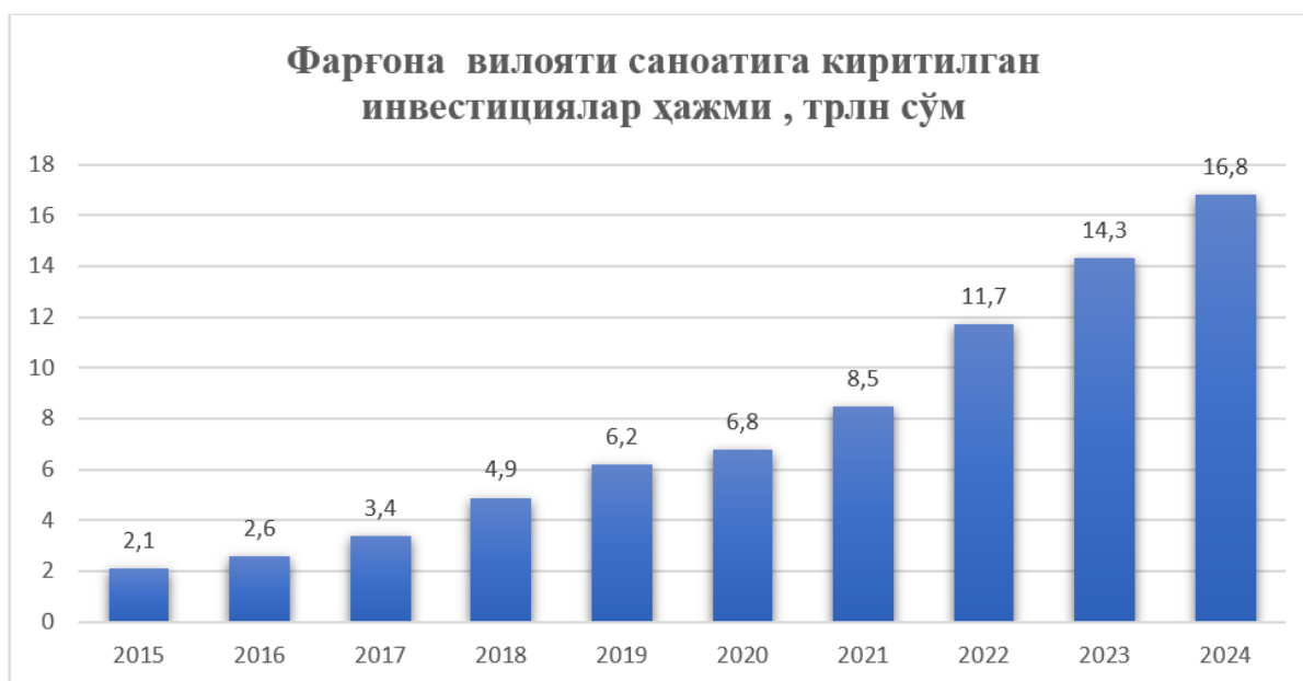
2-rasm. Farg'ona viloyati sanoatiga kiritilgan investitsiyalar hajmi, trln so'm[22]

Farg'ona viloyatida 2015–2025 yillar davomida sanoat korxonalarini soni barqaror va sezilarli oshgan. 2015 yilda 4 320 ta korxonaga faoliyat yuritilgan bo'lsa, 2025 yilda bu ko'rsatkich 8 900 taga etdi, ya'ni qariyb 2,1 barobar ko'paydi. Ushbu o'sish nafaqat sanoat hajmining kengayishini, balki kichik sanoat zonalarini va xususiy sektorning rivojlanishini ham namoyon etadi. Sanoat korxonalarini sonining bu izchil o'sishi viloyatda sanoatni modernizatsiya qilish, innovatsion mahsulot ishlab chiqarish hajmini kengaytirish va energiya sarfi samaradorligini oshirishga qaratilgan davlat siyosatining samarasi hisoblanadi. Shu maqsadda qabul qilingan 2019 yildagi PQ–3521-son "Sanoat tarmoqlarida yuqori qo'shilgan qiymatli va eksportbop mahsulotlar ishlab chiqarishni qo'llab-quvvatlash choralarini", 2018 yildagi PF–5572-son "Xususiy sektorni va kichik sanoat korxonalarini rivojlantirish chora-tadbirlari to'g'risida" qarorlar korxonalar sonining oshishiga sabab bo'lgan. Ushbu hujjatlar sanoat korxonalarini sonining izchil o'sishi va KSZdagi korxonalarining kengayishi orqali viloyatda sanoatni barqaror va samarali rivojlantirishni ta'minladi. Shu tariqa, Farg'ona viloyati sanoat korxonalarini sonining 2015–2025 yillardagi qariyb 2,1 barobar o'sishi davlatning strategik me'yoriy hujjatlari asosida sanoatni uzviy industrialashtirish va xususiy sektorni rag'batlantirish siyosati natijasida amalga oshganligi aniqlandi.