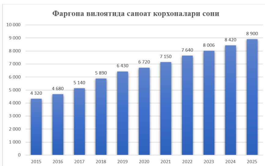
1-rasm. Farg'ona viloyatida sanoat korxonalarini soni [22]

Sanoat ishlab chiqarish hajmining kengayishi, tarmoqlar diversifikatsiyasi va investitsiya faolligining oshishi iqtisodiyotda tarkibiy o'zgarishlarni yuzaga keltirib, tabiiy ravishda yangi korxonalarining tashkil etilishi hamda mavjud ishlab chiqarish sub'ektlarining ko'payishiga olib keladi. Sanoat rivojlangan sari ishlab chiqarish quvvatlari kengayadi, zamonaviy texnologiyalar joriy etiladi, ichki va tashqi bozorlarga mo'ljallangan raqobatbardosh mahsulotlar turi ortib boradi, bu esa yangi xo'jalik yurituvchi sub'ektlar uchun qulay iqtisodiy muhitni shakllantiradi. Natijada korxonalar sonining o'sishi sanoat siyosati samaradorligini, investitsiyaviy muhit barqarorligini hamda hududning iqtisodiy salohiyati izchil mustahkamlanib borayotganini ifodalovchi muhim ko'rsatkich sifatida namoyon bo'ladi.