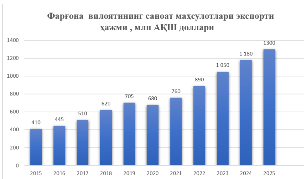
3-rasm. Farg'ona viloyatining sanoat mahsulotlari eksporti hajmi, mln AQSh dollari[22]

Sanoat ishlab chiqarish hajmining izchil o'sishi mahsulotlar turini kengaytirish, sifatini oshirish hamda ularni tashqi bozorlarga yo'naltirish imkoniyatlarini yaratmoqda. So'nggi yillarda eksportbop mahsulotlar ishlab chiqarishni qo'llab-quvvatlash, zamonaviy texnologiyalarni joriy etish va investisiyalarni jalb qilish natijasida viloyatning eksport salohiyati sezilarli darajada oshdi. Tayyor sanoat mahsulotlarining xorijiy davlatlarga etkazib berilishi nafaqat valyuta tushumini ko'paytirishga, balki hududning xalqaro iqtisodiy munosabatlardagi mavqeini mustahkamlashga ham xizmat qilmoqda. Shu nuqtai nazardan, Farg'ona viloyatining sanoat mahsulotlari eksporti hajmi, tarkibi va geografiyasini tahlil qilish hudud iqtisodiyotining raqobatbardoshligi va barqaror rivojlanish tendensiyalarini baholashda muhim ahamiyat kasb etadi.