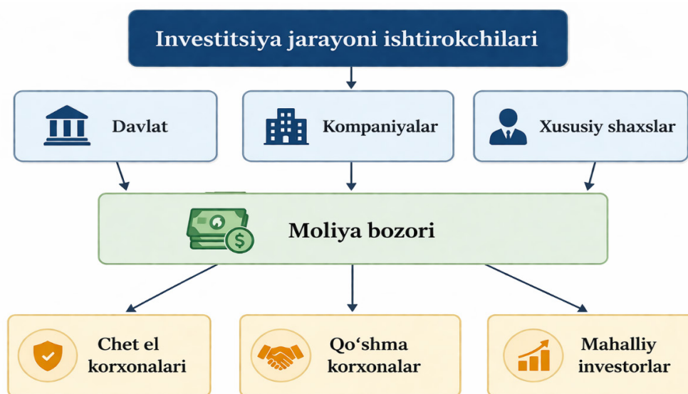
1-Rasm. Investitsiyalash jarayoni [2]

Iqtisodiy nuqtayi nazardan – esa investitsiyalar qilingan xarajatlarga nisbatan kattaroq yoki muhimroq bo'lgan kelajakdagi daromadlarni olish maqsadida mavjud resurslardan zudlik bilan foydalanishdan voz kechishni anglatadi (1-rasm).