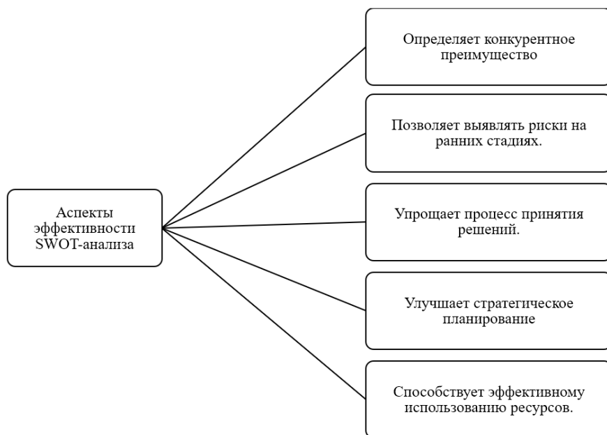
Рисунок 1. Ключевые показатели эффективности SWOT-анализа 2

Эта диаграмма наглядно демонстрирует эффективность SWOT-анализа. Она выделяет пять основных преимуществ: выявление конкурентных преимуществ, предварительная оценка рисков, упрощение процесса принятия решений, совершенствование стратегического планирования и содействие более эффективному использованию ресурсов. Таким образом, диаграмма обобщает практическую ценность SWOT-анализа в деятельности организации или проекта.