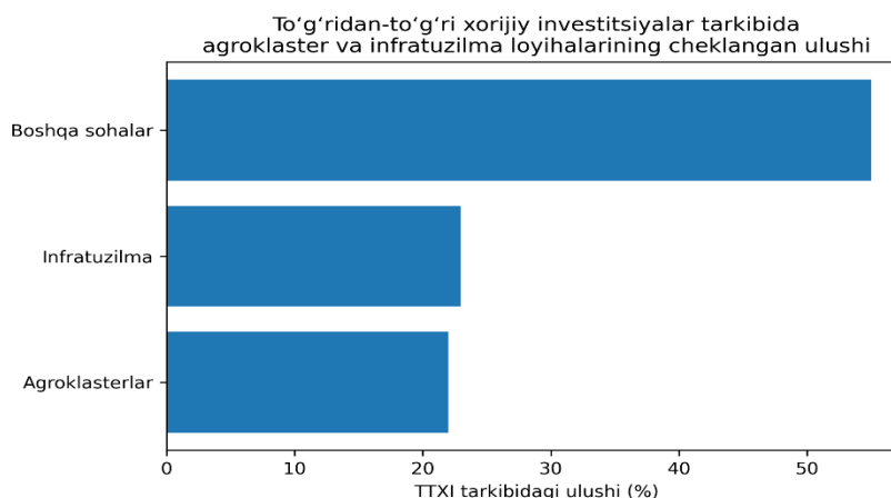
2-rasm. To'g'ridan-to'g'ri xorijiy investitsiyalar tarkibida agroklastlar va infratuzilma loyihalarining cheklangan ulushi 2

Mazkur grafik to'g'ridan-to'g'ri xorijiy investitsiyalar tarkibida agroklastlar va infratuzilma loyihalarining ulushini boshqa sohalar bilan taqqoslagan holda aks ettirib, mavjud muammoning vizual ifodasini beradi.