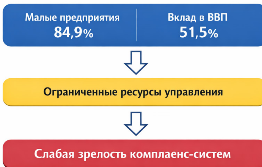
Рисунок 1. Влияние структуры экономики на развитие комплаенс-контроля в Узбекистан

Актуальность рассматриваемой проблематики в Узбекистане определяется масштабом государственного сектора в экономике. По данным Национального комитета по статистике, по состоянию на ноябрь 2025 года в стране функционирует более 465 тыс. предприятий, при этом в ряде стратегически значимых отраслей представлены компании с государственным участием [1]. В этих условиях вопросы обеспечения прозрачности, предотвращения коррупционных рисков и повышения эффективности контроля становятся системными задачами экономической политики (Рис. 1).