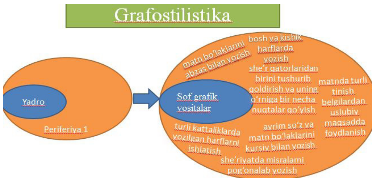
2-rasm. Grafostilistikaning tarkibiy tuzilishi

Yuqoridagi jadvalda ko'rinib turganidek grafostilistik vositalar yozma diskurslarni yozishda va mazkur diskurslarni ekspressiv-emotsional, bo'yoqdorligini oshirishda hamda uni ko'rsatib berishda alohida ahamiyat kasb etadi.