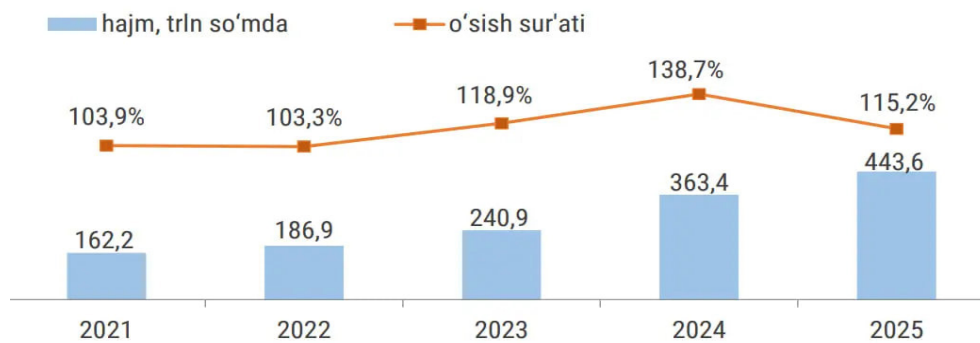
1-rasm. Asosiy kapitalga investitsiyalar dinamikasi 10

Investitsion salohiyatning muhim jihati shundan iboratki, u investitsiyalar hajmi bilan bir qatorda ularning tarkibiy tuzilishi va moliyalashtirish manbalarini ham qamrab oladi. 2025-yilning to'qqiz oyi yakunlariga ko'ra, investitsiyalar o'sishi asosan xususiy va xorijiy kapital hisobiga ta'minlangan. Xususan, markazlashtirilmagan manbalar — korporativ mablag'lar, bank kreditlari va to'g'ridan-to'g'ri xorijiy investitsiyalar hajmi 15,6 foizga oshib, 400,2 trillion so'mni tashkil etgan. Ushbu ko'rsatkichlar investitsiya jarayonlarida bozor mexanizmlarining roli kuchayib borayotganini hamda xususiy sektor faolligining ortayotganini yaqqol namoyon etadi.