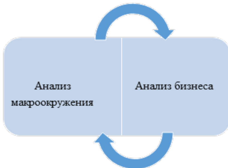
Рисунок 1. Структура бизнес-анализа. 1

Ключевое отличие бизнес-анализа от традиционного комплексного экономического анализа заключается в его расширенном охвате: помимо внутренней деятельности организации, внимание уделяется также внешней среде, в том числе макроэкономическим факторам, отраслевым условиям и конкурентному окружению. Такой подход обеспечивает более полное и стратегически ориентированное понимание функционирования бизнеса. Структурное содержание бизнес-анализа может быть представлено в виде схемы (см. рис. 1).