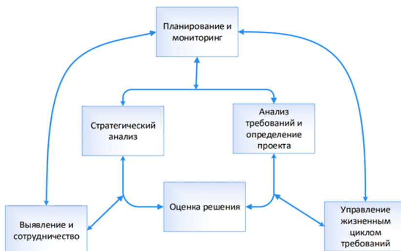
Рисунок 3. Основные области знаний бизнес-анализа. 4

После верификации информации и понимания предметной области, аналитик переходит к практическому этапу — анализу процесса формирования управленческих решений. На завершающей стадии осуществляется оценка реализуемых альтернатив с точки зрения их соответствия целям проекта и эффективности с позиций бизнес-анализа.