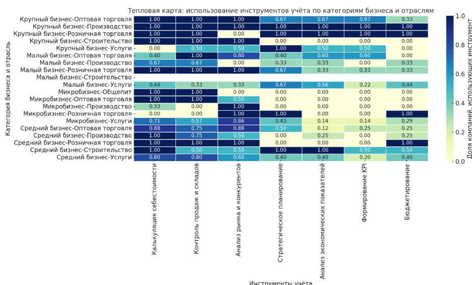
Рисунок 3. Тепловая карта: использование инструментов учёта по категориям бизнеса и отраслям. 5

Для оценки зрелости управленческого учёта в различных отраслях и категориях бизнеса была построена тепловая карта (Рисунок 3), наглядно демонстрирующая уровень использования ключевых аналитических инструментов, таких как калькуляция себестоимости, контроль складов и продаж, анализ конкурентов, бюджетирование, прогнозирование и стратегическое планирование. Каждая ячейка тепловой карты представляет собой числовое значение по шкале от 0 до 1, где 1.00 означает, что соответствующий инструмент применяется всеми компаниями в определённой категории, а 0.00 указывает на его полное отсутствие. Такой подход позволил получить объективное представление о распределении аналитических практик и выявить различия в подходах к управленческому учёту между разными сегментами бизнеса (Рисунок 3).